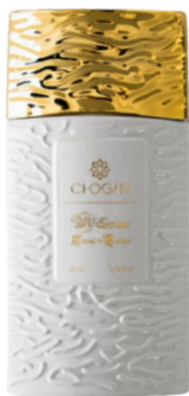
flacon en 35 ml