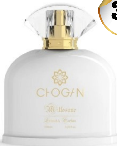
flacon en 100 ml